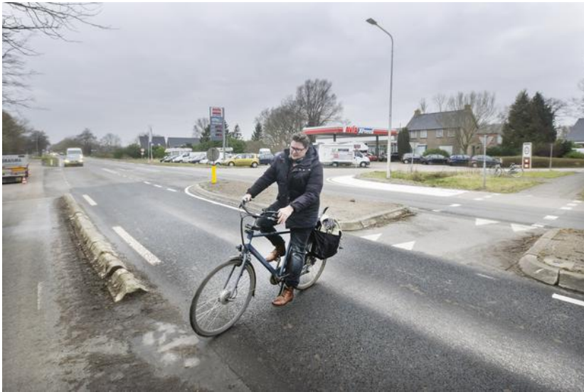
De kruising van de Rijksweg (N355) en het Wyldpaed West ten zuiden van Twijzelerheide.

racefytse, no. Dan jeie se der sa oer. Dat is link.” Eén keer heeft Boonstra hier zelf een ongeluk waargenomen. „Nee, dyjinge hat it net oerlibbe.”