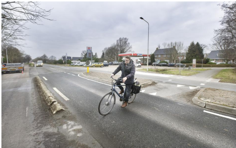
De kruising van de Rijksweg (N355) en het Wyldpaed West ten zuiden van Twijzelerheide.

De kruising van de Rijksweg en het Wyldpaed West tussen Twijzelerheide en Jistrum is voor fietsers het gevaarlijkste kruispunt van Friesland, aldus de Fietsersbond. De LC ging kijken.